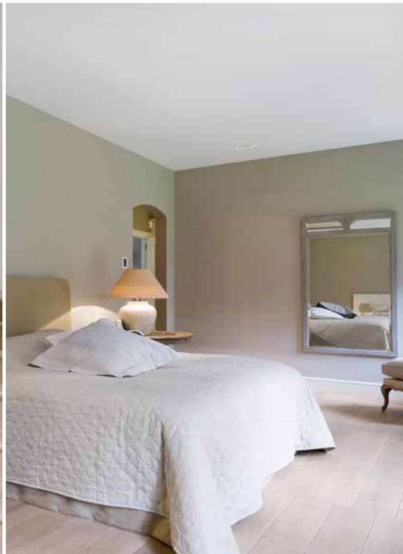
Foto links: de trap is een echt visitekaartje voor de rest van de woning. Oud en nieuw vinden elkaar: de treden en de naar oud model getrokken greep zijn van Franse eik, de smalle balusters zijn van smeedijzer vervaardigd en de hoofdbaluster is een authentieke spijl van gegoten smeedijzer. Foto rechts: omdat een ruimte zoals de slaapkamer vraagt om een vloer die aangenaam is om blootsvoets over te lopen, viel de keuze op eikenhout. In tegenstelling tot de benedenverdieping gaat het hier echter niet om oud hout, maar om nieuwe Franse eiken plankenvloeren.

detail klopt. De combinatie van streng geselecteerde materialen en stijlvolle meubels zorgt voor een onevenaarbare uitstraling. De houten vloeren in de leefkamers en in de eetkamer bijvoorbeeld illustreren dat. “Het is een plankenvloer van oude Franse eik”, verduidelijkt Stefan. “Die hebben we in verschillende leefruimtes doorgetrokken, zodat de symmetrie en de rust naast de centrale aslijn optimaal tot uiting komen. De plankenvloer sluit ook mooi aan bij de authentieke schouwen en het eikenhouten binnenschrijnwerk. Hier en daar hebben we ook smeedijzeren deuren met glas voorzien om extra transparantie te creëren. In de keuken hebben we dan weer een heel ander vloermateriaal gekozen. Geen gewone Bourgondische dalen, maar Pierre de Corton Beige Rosé met uitgesproken roze accenten. Die vormen een verrassend contrast met het eikfineer en met de werkbladen van Franse witsteen.”