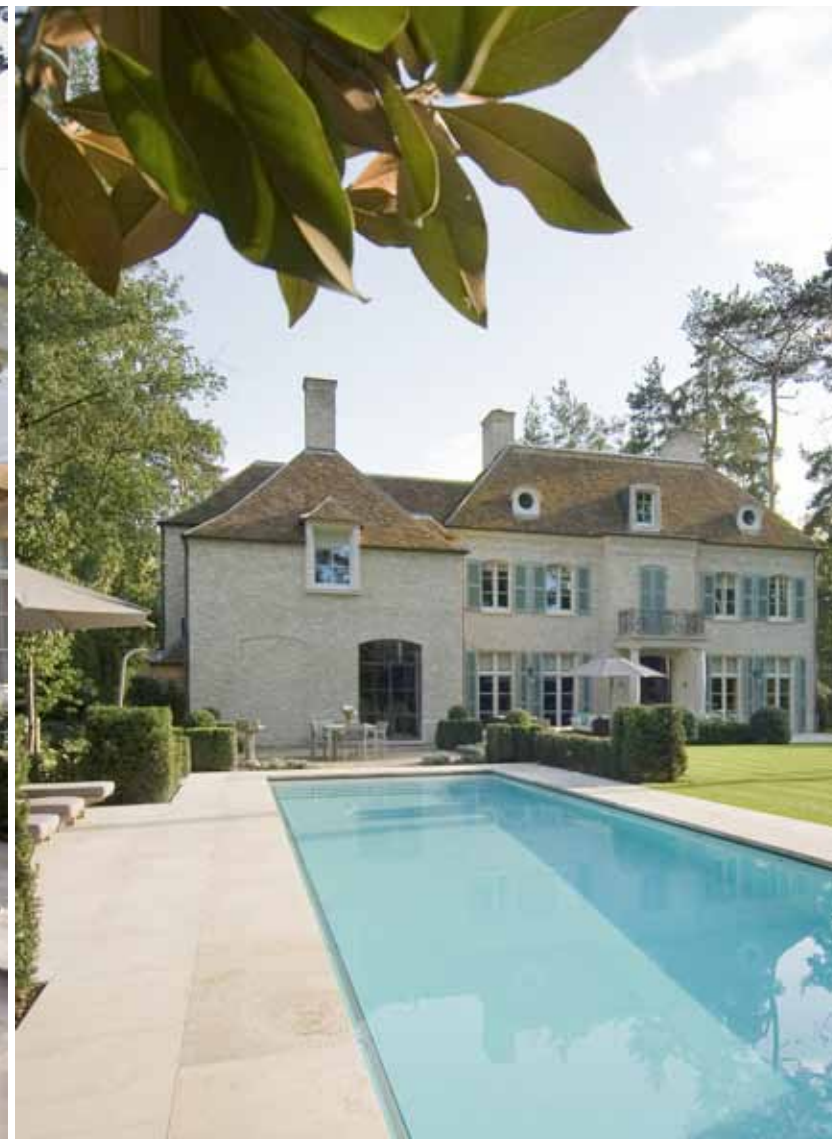
Een totaaloverzicht van de buitenzijde geeft een duidelijk beeld van de oude materialen waarmee dit alles gerealiseerd is: oude Bourgondische tegelpannen op het dak, hergebruikte Zuidwest-Franse beige handvormsteen, Dalles de Dordogne voor de terrassen ... Die gaan hand in hand met verouderde materialen, zoals de ecru geschilderde ramen, de grauwbloauwe luiken, de smeedijzeren ramen aan de eetkeuken en de vergrijsde eiken voordeur.