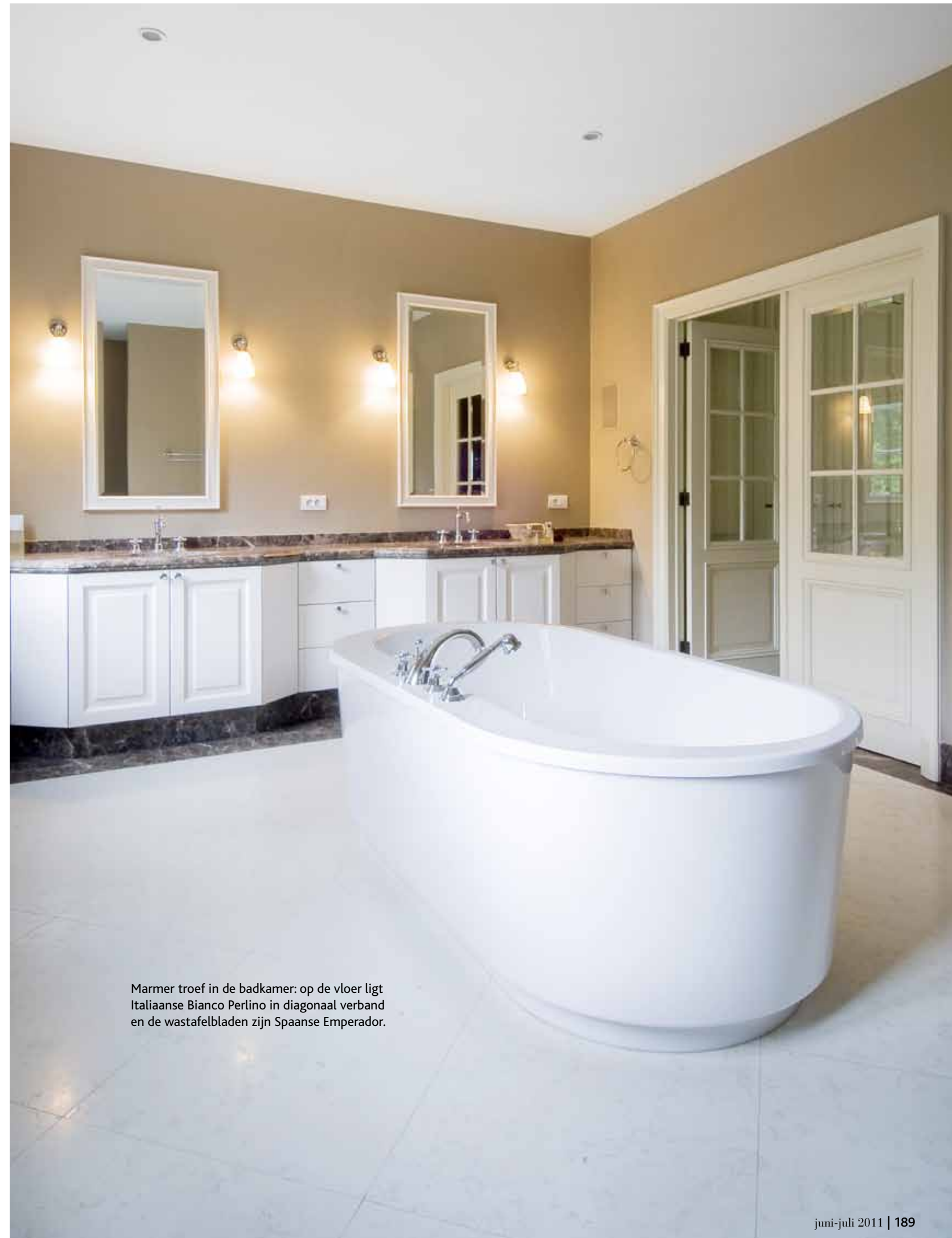
Marmer troef in de badkamer: op de vloer ligt Italiaanse Bianco Perlino in diagonaal verband en de wastafelbladen zijn Spaanse Emperador.

De sfeer van de benedenverdieping zet zich ook door op de bovenverdieping, met dat verschil dat er hier grotendeels met nieuwe, verouderde materialen gewerkt is, zoals de plankenvloer van Franse eik die aangenaam is om blootsvoets over te lopen, de op maat gemaakte kasten van handgeschilderd mdf en de marmeren vloer op de badkamer. Een ander leuk detail is dat een van de slaapkamers uitkomt op een elegant balkon, waar de bewoners zich volledig kunnen laten inpalmen door de prachtige materialen en de grauwbloauwe functionele luiken én waar ze tegelijk ook kunnen genieten van de prachtig aangelegde tuin, die dankzij zijn structuur en materiaalgebruik helemaal in de sfeer van het geheel past. Of zoals we eerder al aanhaalden: elk detail klopt. ■