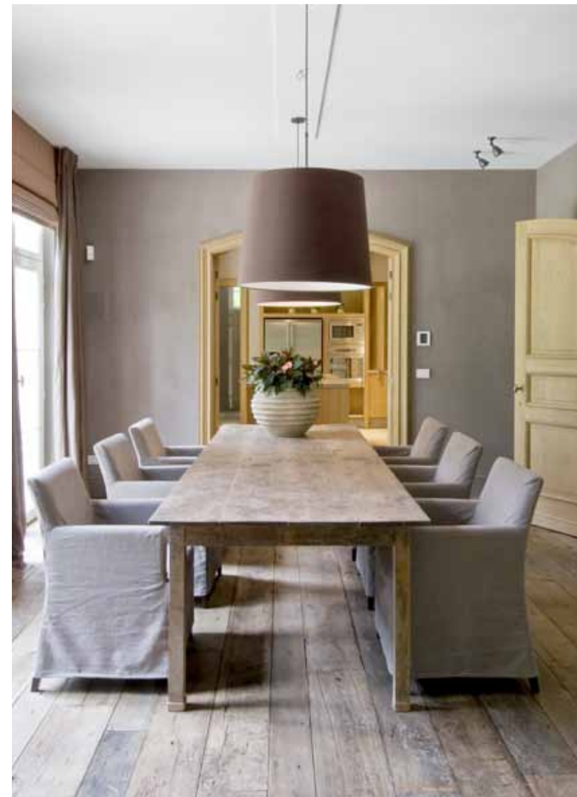
Foto links: de houten vloeren in de verschillende leefruimtes zijn gemaakt van oude Franse eik. Ze hadden geen extra behandeling meer nodig om hun huidige uitstraling te krijgen. Alle meubels komen van De Appelboom. Foto rechts: de Bourgondische dallen op de benedenverdieping zijn niet volledig beige, maar hebben roze accenten. Het geeft de woning een unieke uitstraling en het is ook een knipoog naar de paarse tinten die hier en daar op de wanden toegepast zijn.

De keuken is op maat vervaardigd uit eikfineer. Het kookgedeelte zit, zoals dat traditioneel het geval was, tegen de wand, waardoor het eiland functioneert als voorbereidings- en spoeliland. De werkbladen en de plinten zijn van een Franse witsteen met een grauwbriune kleur uit een klein dorpje in de Vogezes.