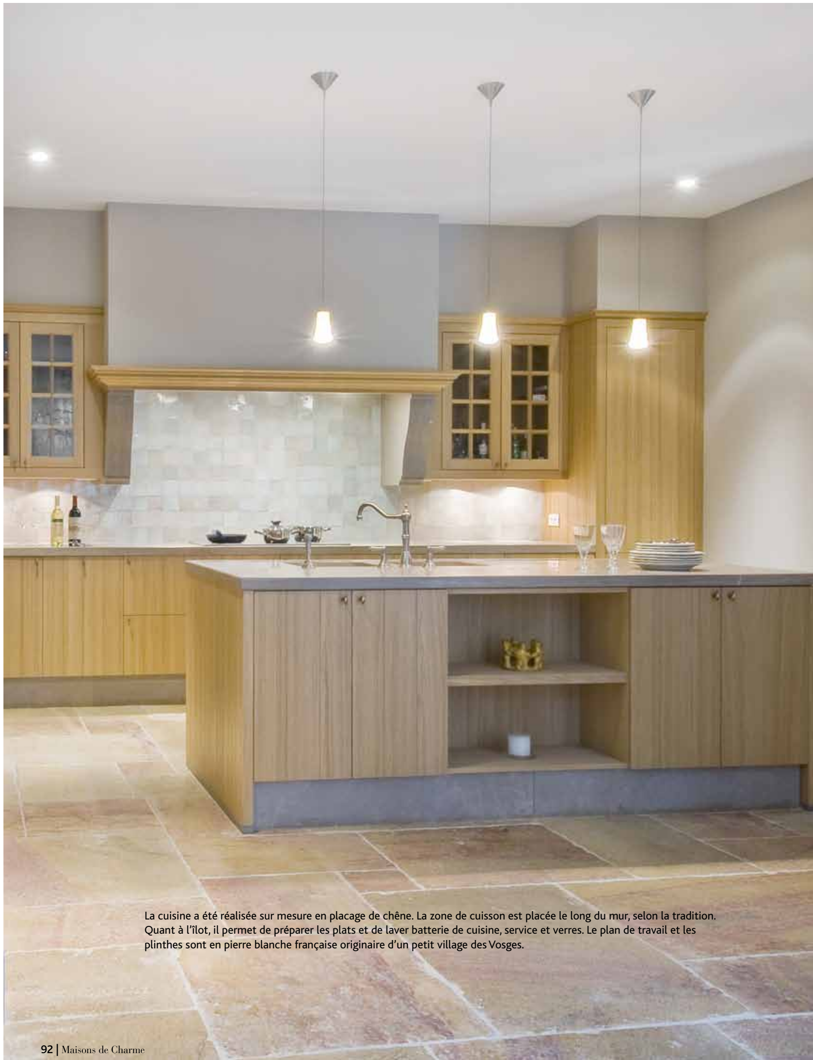
La cuisine a été réalisée sur mesure en placage de chêne. La zone de cuisson est placée le long du mur, selon la tradition. Quant à l'îlot, il permet de préparer les plats et de laver batterie de cuisine, service et verres. Le plan de travail et les plinthes sont en pierre blanche française originaire d'un petit village des Vosges.