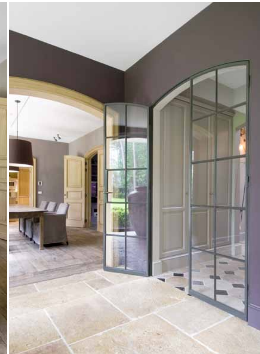
Photo à gauche : les planchers des différents séjours sont en chêne français ancien. Il n'a fallu aucun traitement particulier pour mettre en valeur leur rayonnement actuel. Tous les meubles viennent de la boutique De Appelboom. Photo à droite : les dalles bourguignonnes de l'étage inférieur ne sont pas entièrement beiges. Elles sont parcourues de nuances roses, ce qui donne au logement un effet unique et rappelle en un clin d'œil discret les tons de mauve appliqués à certains murs.

habitants l'ont achetée. Pour les finitions concrètes, comme le choix des matières au sol, ils ont tout de même eu leur mot à dire. Mais même sur ce point, ils se sont laissé guider par Costermans Villaprojecten. « Nous connaissons la société et son potentiel depuis un bon moment », expliquent-ils. « Quand nous contemplons le résultat final, nous pouvons dire si nous l'aimons. Mais nous concentrons intensivement sur la comparaison d'échantillons ou la recherche de matières n'est pas franchement notre tasse de thé. Nous n'en avons pas eu besoin, car l'équipe de Costermans a su, à chaque fois, toucher la corde sensible. Il n'y a que dans la cage d'escalier que nous avons fait remplacer les dalles en terre cuite proposées par un sol à motif en dalles bourguignonnes et en ardoise franco-belge. »